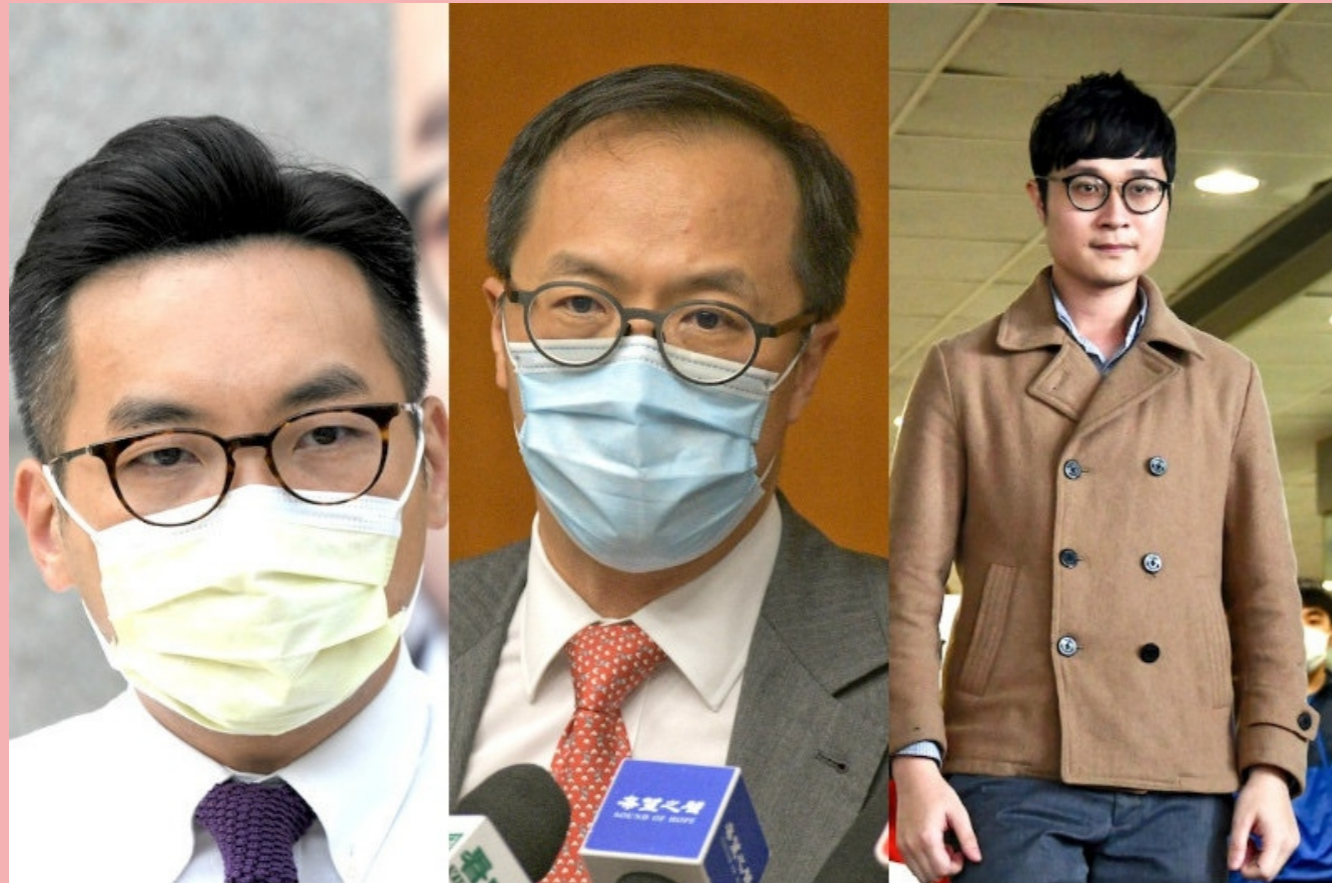
(部分立法會參選人收到選舉主任來信提問)