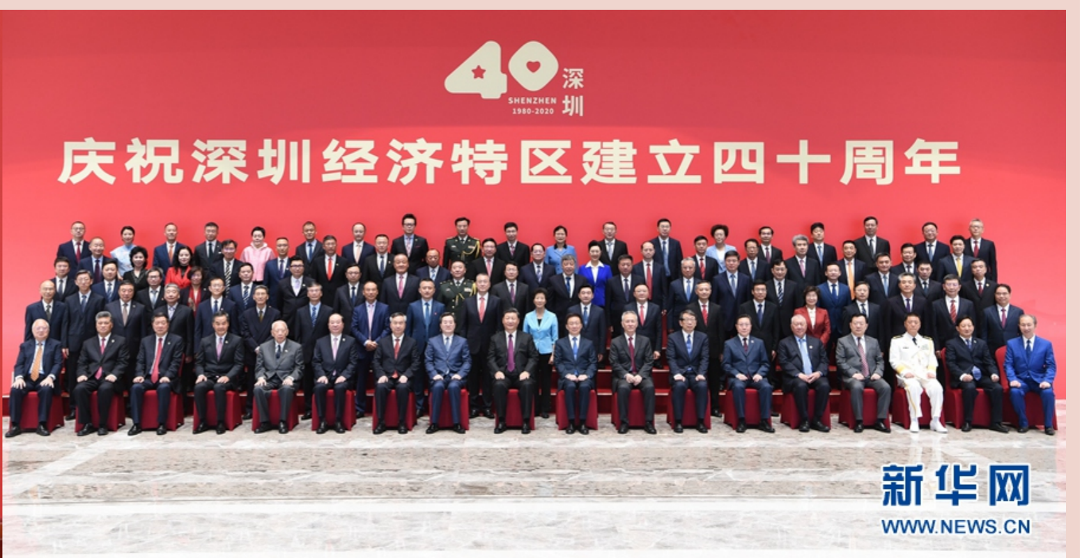
10月14日，深圳經濟特區建立40周年慶祝大會在廣東省深圳市隆重舉行。中共中央總書記、國家主席、中央軍委主席習近平在會上發表重要講話。