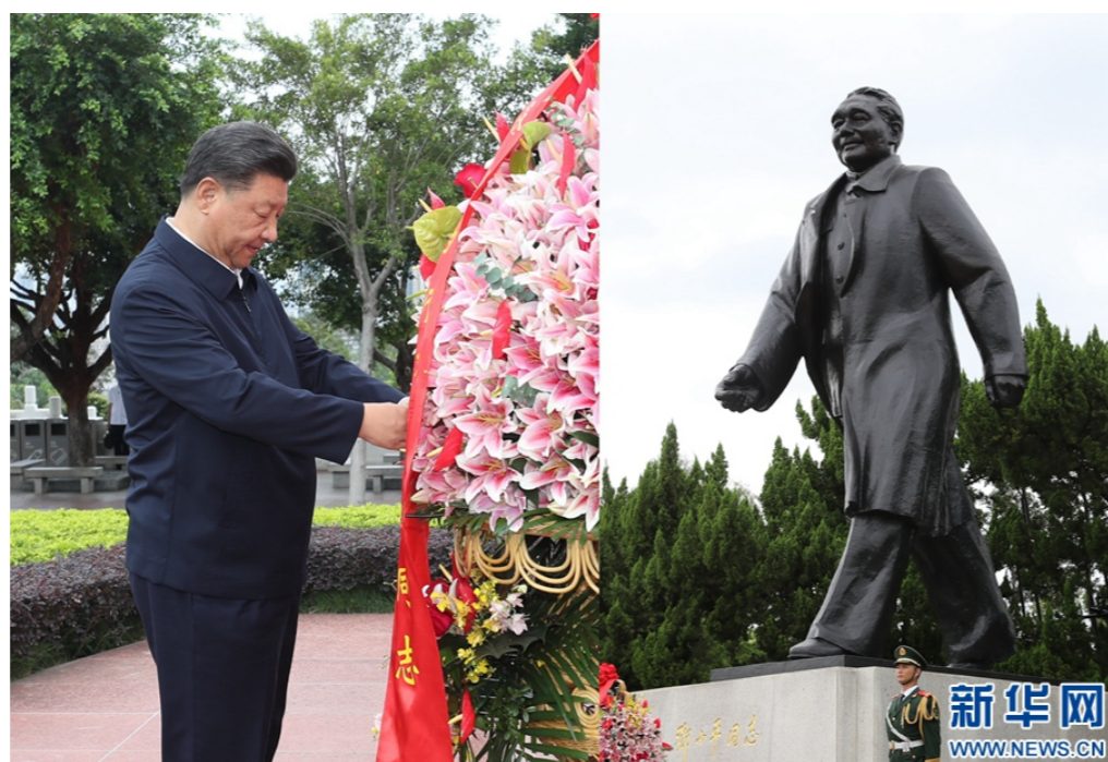
10月14日，深圳經濟特區建立40周年慶祝大會在廣東省深圳市隆重舉行。中共中央總書記、國家主席、中央軍委主席習近平在會上發表重要講話。這是當天下午，習近平來到蓮花山公園，向鄧小平同志銅像敬獻花籃。

習近平指出，深圳是改革開放後黨和人民一手締造的嶄新城市，是中國特色社會主義在一張白紙上的精彩演繹。40年來，深圳奮力解放和發展社會生產力，大力推進科技創新，實現了由一座落後的邊陲小鎮到具有全球影響力的國際化大都市的歷史性跨越；堅持解放思想、與時